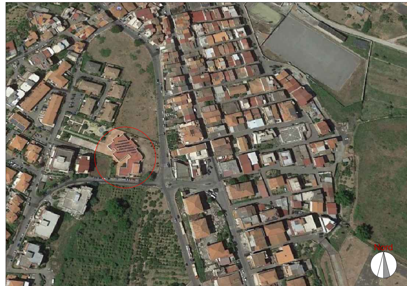
ORTOFOTO_INDIVIDUAZIONE DELL'EDIFICIO OGGETTO DI INTERVENTO